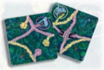
59 čtvercových karet